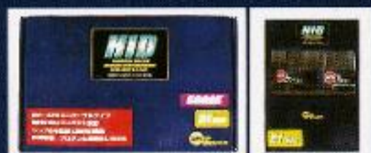
HIDシステムフルセット

暗闇を照らし、良好な視界を確保するヘッドライトだから、基本性能にもこだわりました。シェード部のデザインを見直し、効率の良い配光が夜間や荒天時の視界を安全に確保。常に安定した電流を供給できるから、連続したパッシングや夜間走行時のHi-Lo切替にも余裕を持って対処できます。